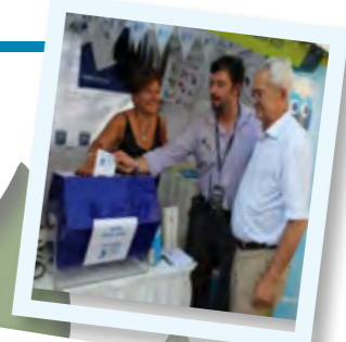
The Consul General of Greece in Melbourne, Christina Simantiraki, touring Omiros College stall.