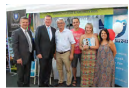
The Premier of Victoria, Dr Denis Napthine, with Nicholas Kotsiras, Minister for Multicultural Affairs and Energy, visiting Omiros College stall, at the 2014 Antipodes Festival.